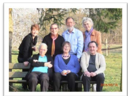
Het bestuur van Gamrupa Europe